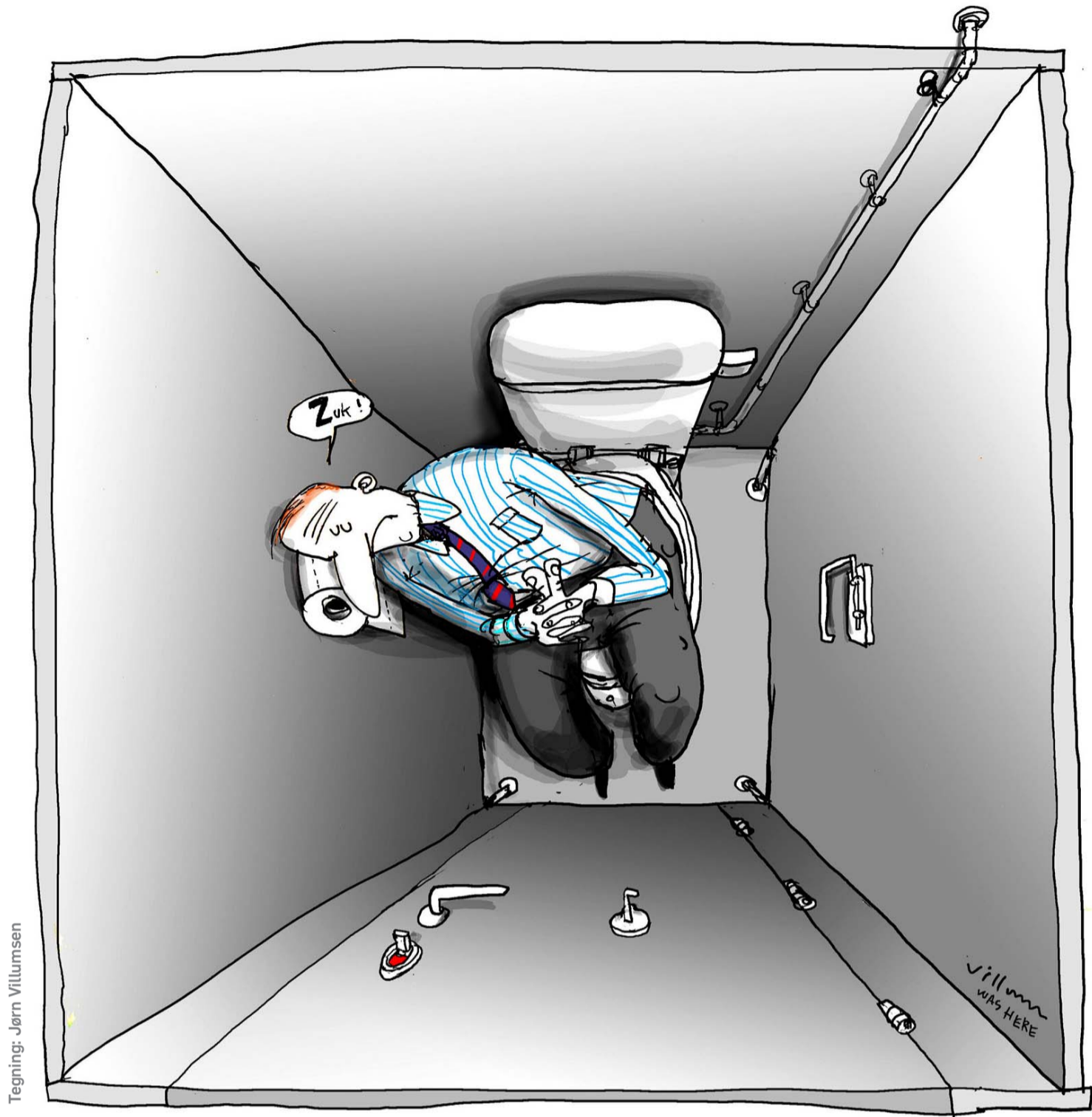
Tegning: Jørn Willumsen

Det skal derfor kun tages som mine strøtanker om en, efter min mening, tidstypisk tendens. Så giv endelig jeres besyv med; der kan sikkert findes mange flere gode ideer til at få det optimale ud af de mange toiletbesøg, vi alle er på hver evig eneste dag – både når naturen kalder, men så sandelig også når den ikke gør det! Værsgo at skylle.