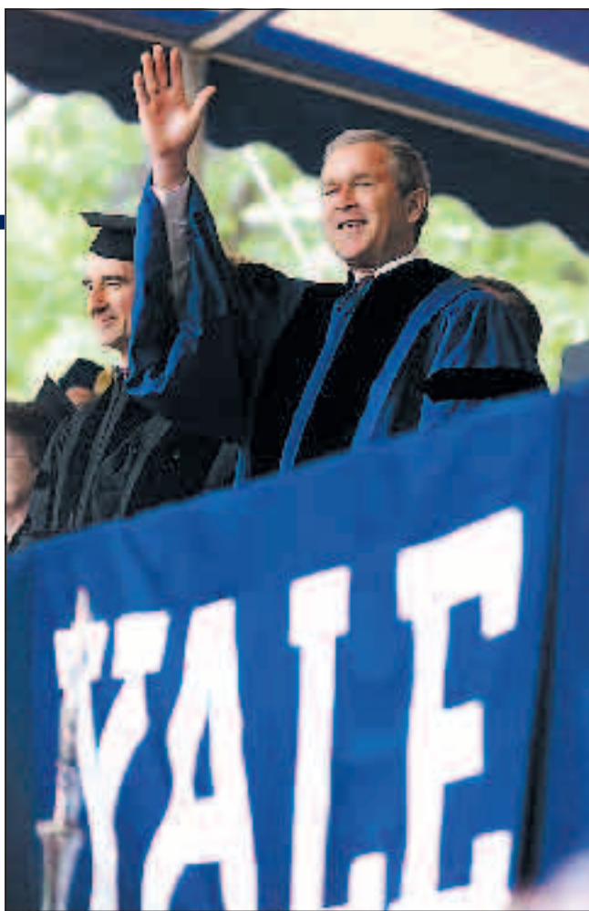
Da Yale er udklækningscentral for mange amerikanske præsidenter, er universitetet toneangivende i den internationale debat. I næste uge åbner Københavns universitet kontor på Yale for at styrke samarbejdet om alt fra klima- til personalepolitik.

Selvom en dansk universitetsrektor næppe vil operere med en målsætning om at påvirke verden, er de danske universiteter i fuld sving med at tilpasse sig internationaliseringen. I et globalt videnssamfund, hvor forskere og studerende i stigende grad bevæger sig over grænserne, er en »insulær« holdning uforenelig med målsætningen om at drive topforskning og attraktive uddannelser. Eller for at citere fra KU's første samlede strategi, Destination 2012: »KU kan